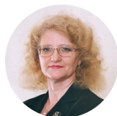
проф., з.д.н. РФ Г.А. Рыжак