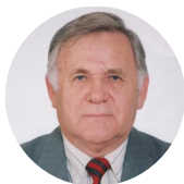
академик РАН А.Д. Ноздрачев