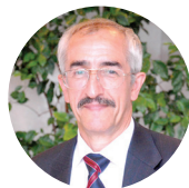
Член-корр. РАН В.Н. Анисимов