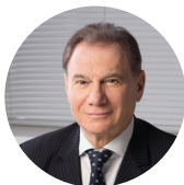
Член-корр. РАН, з.д.н. РФ В.Х. Хавинсон